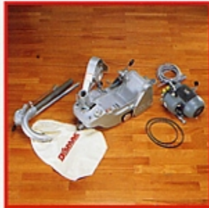
■ Macchina smontata