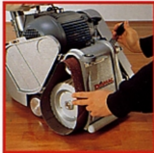
■ Facile sostituzione del nastro