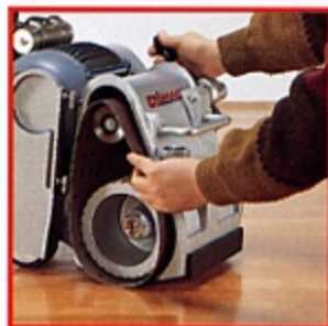
■ Facile sostituzione del nastro