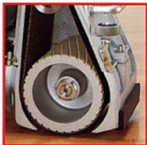
■ Rullo levigatore

In caso di necessità il tubo di aspirazione può essere smontato velocemente e semplicemente.