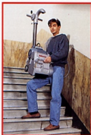
■ Facilità di trasporto